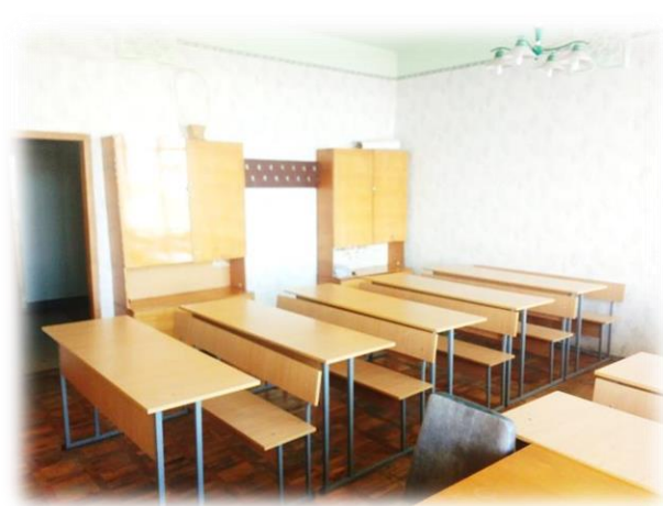
Аудиторії 643, 645 (6 поверх)