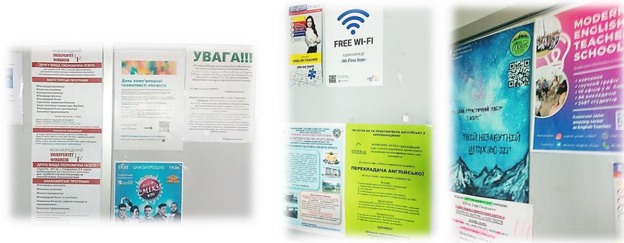
Викладацька та інформаційні стенди ауд. 601 (6 поверх)