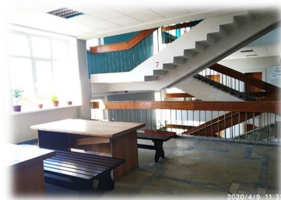
Коридори та холи (7 поверх)