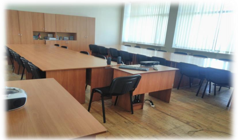
Аудиторії (7 поверх)